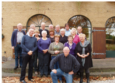
- Groepsfoto bij de Schoutenhof -