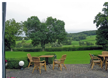
- het uitzicht is adembenemend -

Woensdag is voor de deelnemers van de vijfdaagse wandelweek de dag van de verandering. Het verleden laten de PiZ-cursisten achter zich, vanaf nu richten ze zich op de toekomst. De wandeling van vandaag markeert deze verandering. Vanmorgen is afscheid genomen van Hotel Vue des Montagnes in de buurt van Valkenberg. De trein brengt het gezelschap naar het Schin op Geul. Daar begint een prachtige tocht door het Gerendal, over het Plateau van Margraten, langs de Gulp naar Epen.