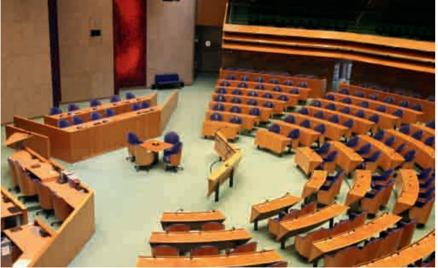
De Tweede Kamer in Den Haag vormt de achtergrond waartegen op 16 april voor de derde keer het landelijk debattoernooi voor or-leden worden gehouden.