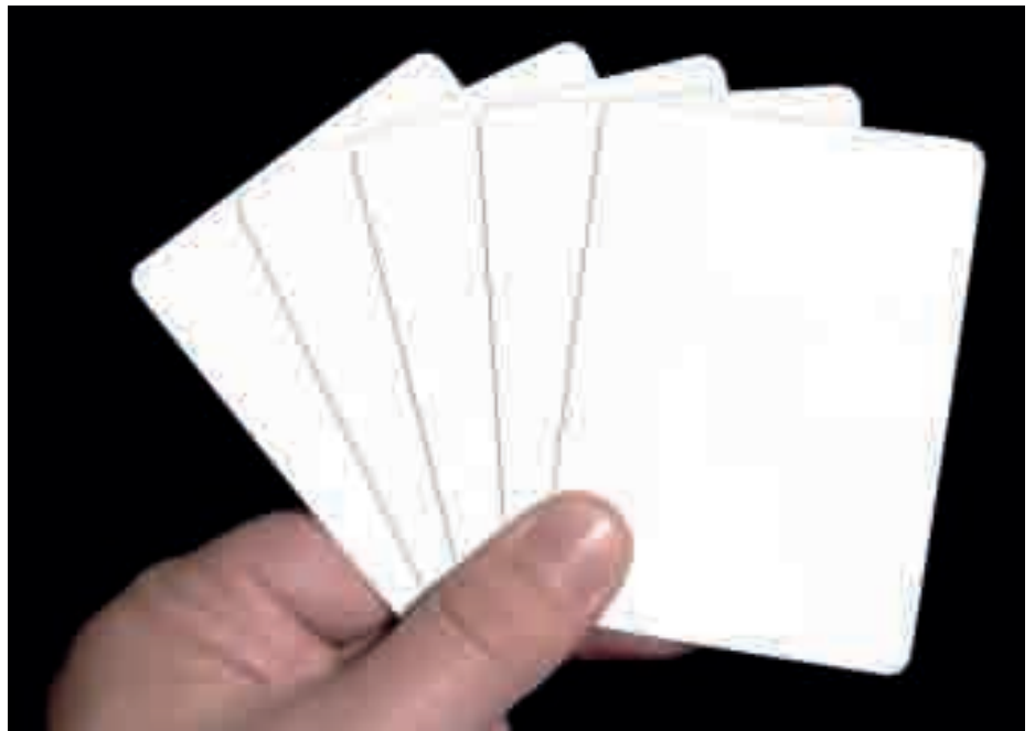
Als je geen troeven in handen hebt, moet je soms bluffpoker spelen

Als in dit stadium de personele gevolgen nog niet goed in beeld zijn, wordt het een advies onder voorbehoud, aangezien de or in elk geval formeel het recht behoudt te adviseren over de personele gevolgen, in afstemming met de rol die de bonden in het go hebben.